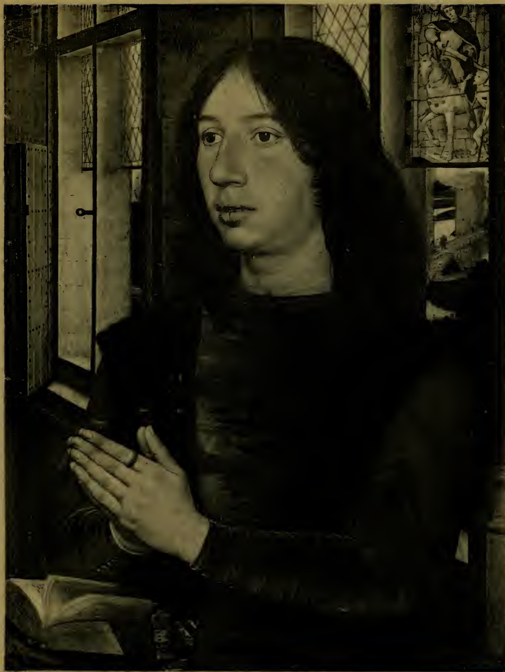
Portrait de Martin van Nieuwenhoven, Donateur du Diptyque : La Vierge à la pomme.